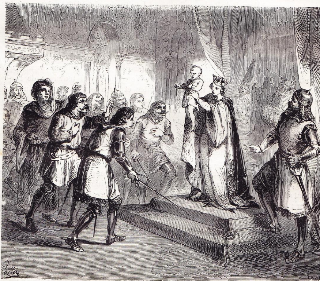
Jeanne de Montfort présente son fils aux seigneurs bretons (1341).

La première, sous les ordres du comte Derby, débarqua en Guyenne, s'empara de la Réole, de Port-Sainte-Marie, et