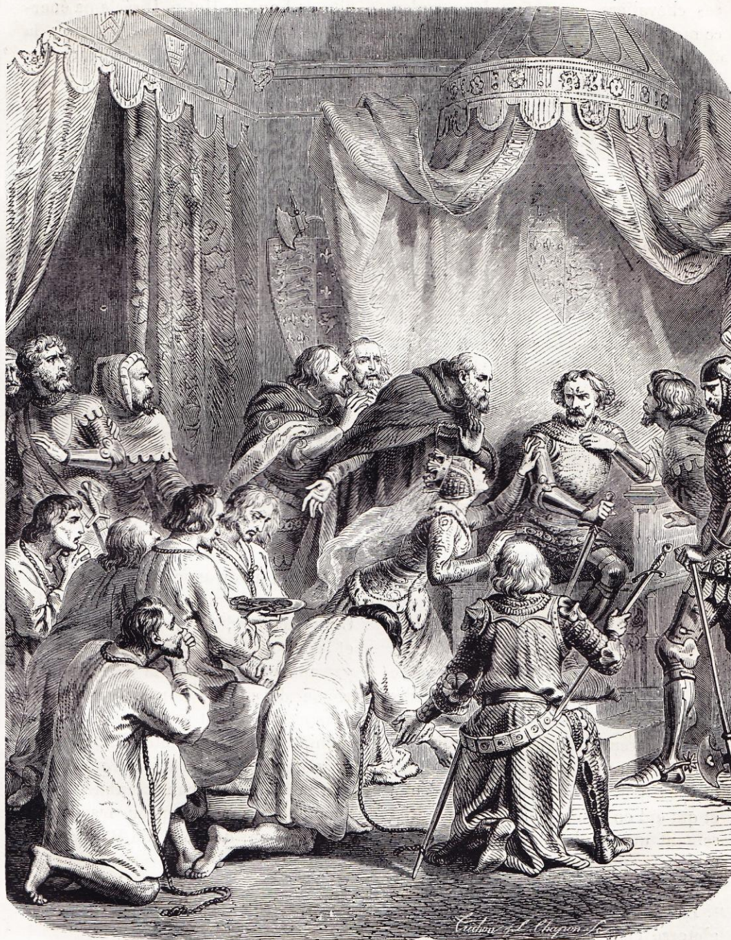
Les bourgeois de Calais (1347).

trenté et un ans, lorsqu'il succéda à son père. Depuis longtemps associé aux affaires, il était, comme Philippe, brave,